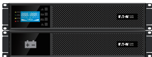
C-1000RM / C-2000RM / C-3000RM