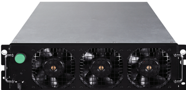
93PR 25kW 不斷電模組 (UPM)

VMMS 可於 UPS 負載等級極低時仍達到高效率 (通常適用於備援 UPS)。VMMS 可將單一 93PR UPS 中的功率模組負載等級最佳化；或於並聯系統下，藉由中止額外 UPS 功能達到最佳效果。這表示不僅在低負載等級下效率絕佳，且於所有負載等級下仍可擁有最佳化效率。