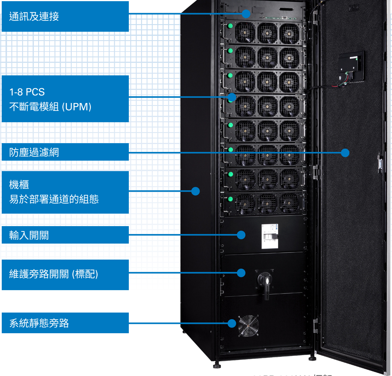
93PR 200kW 框架

可用性的最大化是業務持續不可缺少的因素之一，而這也是伊頓 93PR UPS 設計的一環，它能確保關鍵任務應用程式獲得所需的電力。